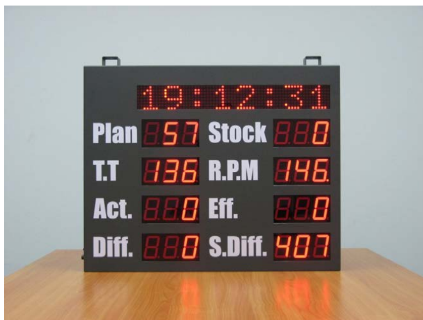
Afb: Voorbeeld Visible Management

Het laatste wat een verbeterteam te doen staat bij het oplossen van een probleem, is het communiceren van de resultaten in de organisatie. Dit kan op verschillende manieren gebeuren, zoals bijvoorbeeld het ophangen van trendgrafieken. Communiceren richting de hele organisatie ("Kijk eens wat een mooi resultaat!") is essentieel om een tevreden gevoel bij procesbetrokkenen te creëren. Binnen Lean Six Sigma noemen we dit ook wel Visible Management.