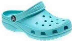
Crocs Aqua Clog