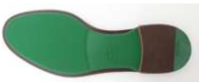
Prada Gemeenschapsmodel schoenzool