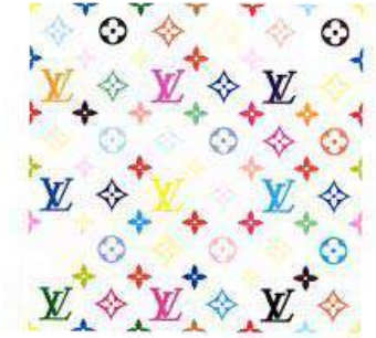
Louis Vuitton Gemeenschapsmodel

Ook dessins en patronen kunnen als model worden beschermd.