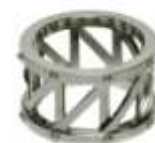
Hermès Gemeenschapsmodel ring